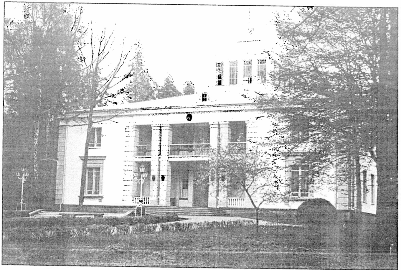
* архітэктар Бакланаў, практуючы ў 1957 годзе будынак лясной дачы для знаці, мог звязаць ягоны лёс хіба што з паляўнічымі, а не палітычнымі заплатамі.

Аднак здараюцца экскурсіі і празмерна палітызаваныя. Вядома, у залежнасці ад аўдыторыі і асобы гіда. Адночы мне давялося быць сведкам, як перад групай прамыслоўцаў з СНД давераны экскурсавод на